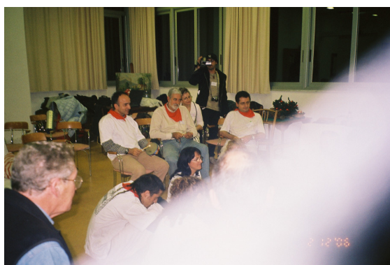
Dos fotografías sacadas con dos cámaras diferentes, una electrónica y otra tradicional, en el momento de la energetización de las piedras