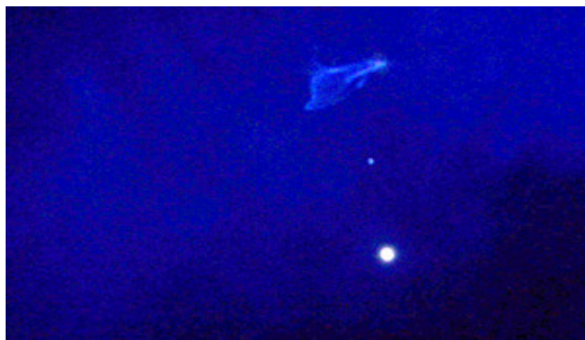
Foto nave plasmática de Tseyor Abajo, la Luna llena.

Hemos estado ahí afuera viendo la Luna con una aureola doble en todo su alrededor de una amplitud tal que ocupaba la mayor parte del cielo visible desde el lugar en que estábamos. Ha sido una sorpresa pues no es frecuente que la aureola que se forma con la luz lunar y las nubes delgadas produzcan aquí esta clase de visión, cosa que parece más frecuente en cambio en otros lugares.