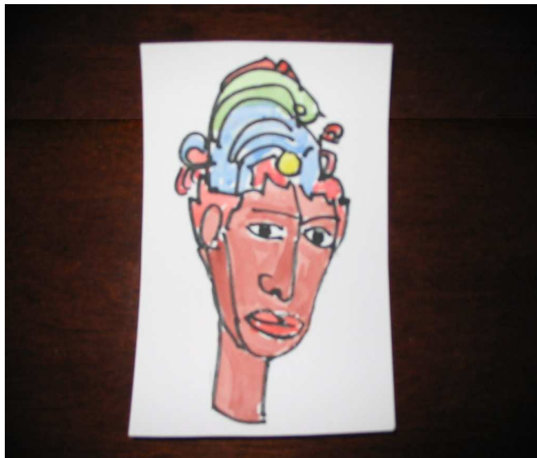
Burda reconstrucción de la apariencia de Aumnor de Ignus.

De nuevo regresé a mi cuerpo y me dormí. Y nada más. Un fuerte abrazo a todos de Puente.