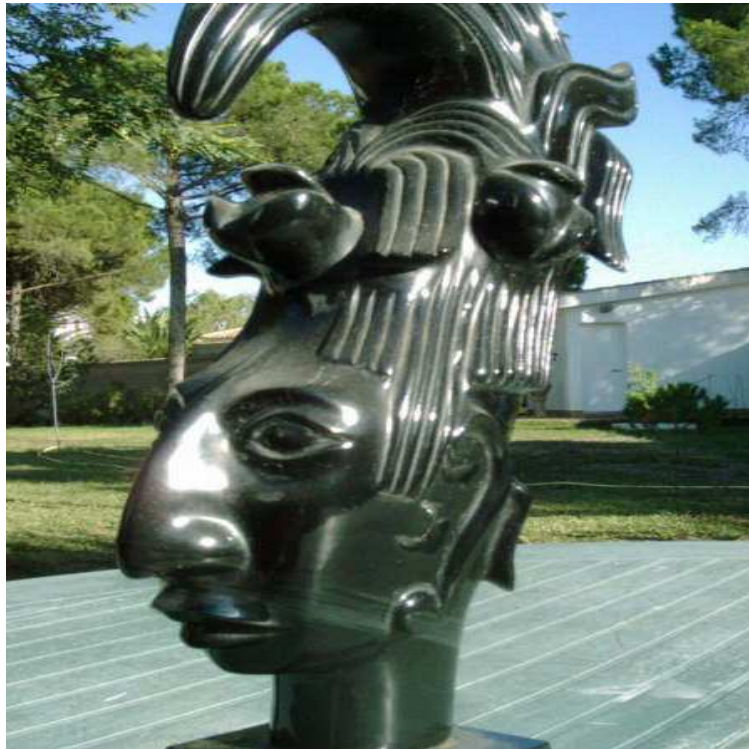
Escultura de un guerrero maya