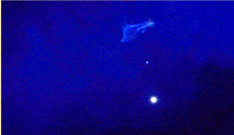
Foto nave plasmática de Tseyor obtenida en Barcelona-España en las Convivencias de Vallvidrera - Diciembre 2006 -Abajo, la Luna llena. Ver canalización número 106 de fecha 2 Diciembre 2006.